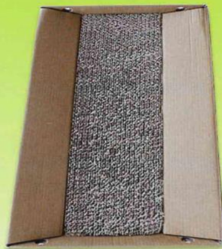
Под с драскалка